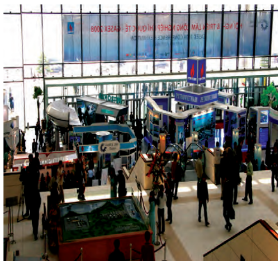
俯瞰 GASEX2008 展览会会场

GASEX展览会于1990年第一次举办,以后每两年一届,GASEX2008是第十届。在过去的18年中,包括中国、日本、韩国、越南、新加坡、马来西亚、泰国、菲律宾、文莱、印度尼西亚、中国香港、中国台北、巴布亚新几内亚、澳大利亚和新西兰共15个GASEX成员国参加了展览会,每届展览会还有欧洲和美洲燃气工业展商参与。此次展览会上国际煤气联盟(IGU)主席