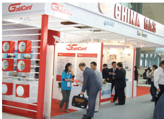
中国参展商与参观者交流