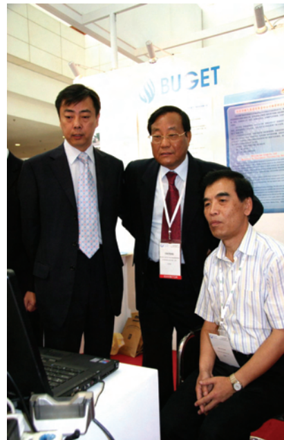
北京优奈特燃气工程技术有限公司