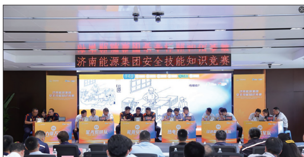
图2 安全知识竞赛活动

为进一步树牢安全生产发展理念，全力营造“安全是‘1’，‘1’失万无”的良好氛围，充分发挥“安全文化传播体系”引导作用，围绕“创优争先”、“文化宣讲”、“岗位禁令”等安全文化建设载体，总结提炼出“宣传安全文化典型”、“配强安全管理队伍”等6大实践路径，推动安全文化理念落地生根，让安全文化贯穿公司生产管理各个环节，夯实了企业高质量发展的根基。此外，公司广泛开展“安全文化大家谈”、“安全知识竞赛”、“主要负责人讲安全”等活动，如图2所示；组建安全培训师团队，系统开发安全管理课程；开展“挑刺找茬”活动，强化各层级主要负责人安全履责和引领作用，全面推动各项安全管控措施落实到位。