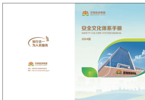
图1 安全文化体系手册

为了将安全使命、安全理念、安全价值观和行为准则整合成一套易于理解和实施的指南,公司修订下发《安全文化体系手册(2024)》,如图1所示。该手册回答了安全文化“为什么做”,又指明了“做什么”“怎么做”的方法和途径,是企业安全文化建设的阶段性成果,为基层单位开展安全文化建设指明了方向,为进一步探索安全文化体系构建提供了遵循,助力安全文化入脑入心并转化为广大员工的日常准则和坚定信念,切实将安全文化“软实力”转化为安全发展“硬实力”。